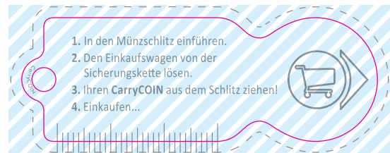
Rückseite CarryCOIN (Seite 2)